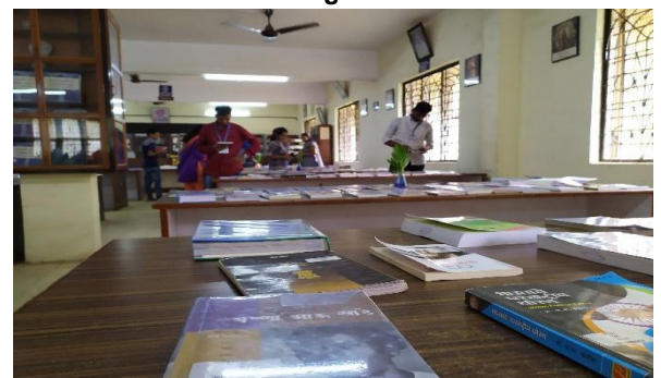
Student attending books Exhibition