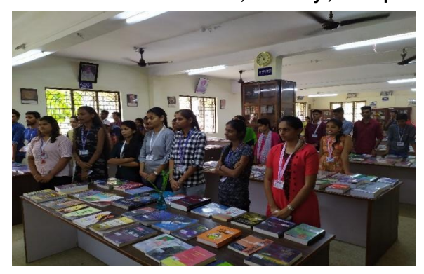
Students attending books Exhibition