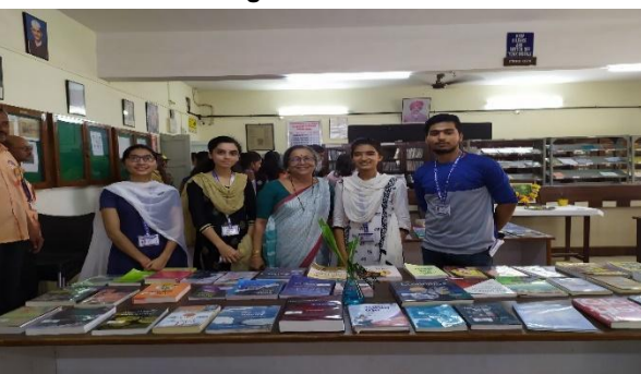
Students photo with guest